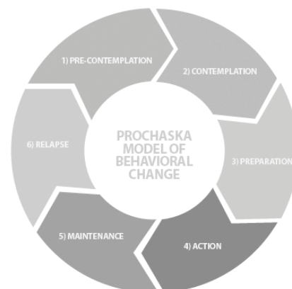
Figura 1 Il modello del cambiamento di Prochaska e Di Clemente.

Si stima che circa un terzo dei fumatori tenti di smettere ogni anno e che nove di questi tentativi su dieci venga effettuato senza un aiuto formale e strutturato, presentando un tasso di ricadute a lungo termine di più del 90% [8]. D'altro canto, anche fra chi smette di fumare con un aiuto esterno il tasso di ricadute entro l'anno rimane elevato, attestandosi attorno al 70% [9]. Gli studi longitudinali indicano a loro volta che col passare del tempo i tassi di ricaduta non si stabilizzano ma continuano ad aumentare costantemente, seppur in misura inferiore [10]. Sono dunque relativamente poche le persone che riescono a raggiungere una stabile astinenza dalle sigarette al primo tentativo. Questi dati nel loro complesso sottolineano la necessità di strutturare un intervento che consenta al fumatore in remissione di avere adeguati strumenti di presidio atti alla prevenzione delle ricadute. Nonostante questa consapevolezza, negli ambulatori specialistici di