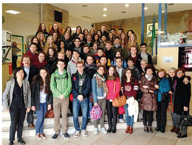
Gli allievi del Marinelli e i loro ospiti canadesi dell'Uts Toronto

Canada e Friuli: terre di confine, due paesi geograficamente distanti tra loro, ma culturalmente molto vicini. Questo anche grazie allo scambio che il liceo Marinelli ha avuto con la Uts di Toronto. Proprio questo mese gli allievi della scuola canadese sono stati ospiti in Friuli per una decina di giorni ricambiando così la visita che gli studenti del Marinelli avevano effettuato lo scorso ottobre. Cinque mesi prima erano toccato alla classe quarta D andare oltre Oceano insieme con due docenti per visitare la città di Toronto e i forti difensivi nell'Ontario in un viaggio che ha ripercorso le tappe più significative della colonizzazione britannica del Canada. Gli studenti canadesi, a loro volta, durante il soggiorno in Friuli hanno avuto l'occasione per conoscere i siti friulani più importanti, tra cui quelli che un tempo erano postazioni strategiche dell'impero romano. Dal confronto delle due colonizzazioni è nato un lavoro congiunto dal