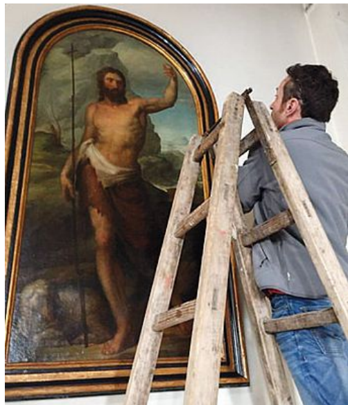
La ricollocazione della pala d'altare di San Giovanni Battista realizzata da Odorico Politi all'inizio del XIX secolo. L'opera d'arte era stata trasferita dopo il terremoto e ospitata per anni al museo diocesano

Con un proprio speciale gazebo si ritrovarono per raccogliere idee e proposte, fra queste anche il lancio di una petizione a sostegno del rientro delle opere d'arte più preziose, un tempo conservate nella chiesa parrocchiale di San Giacomo (nota per essere il luogo di cul-