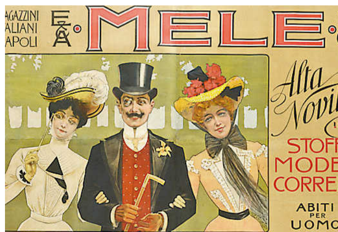
Un manifesto della Collezione Salce, anno 1900

Margherita si esplora il mondo dell’occhiale attraverso due piani di lettura: l’Arte del Vedere è un ideale dialo-