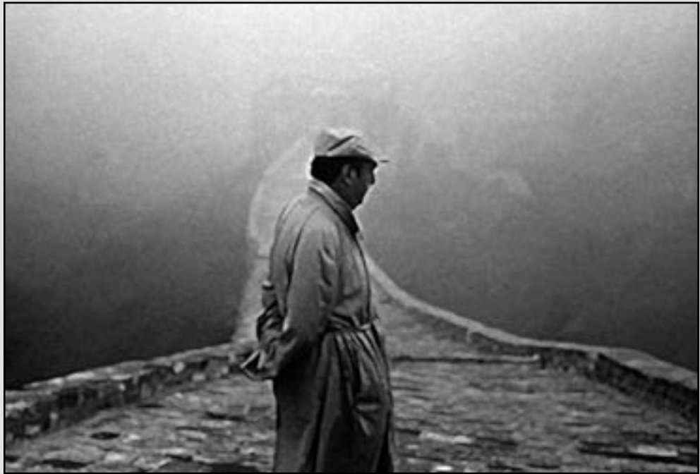
Pablo Neruda sulla Muraglia Cinese