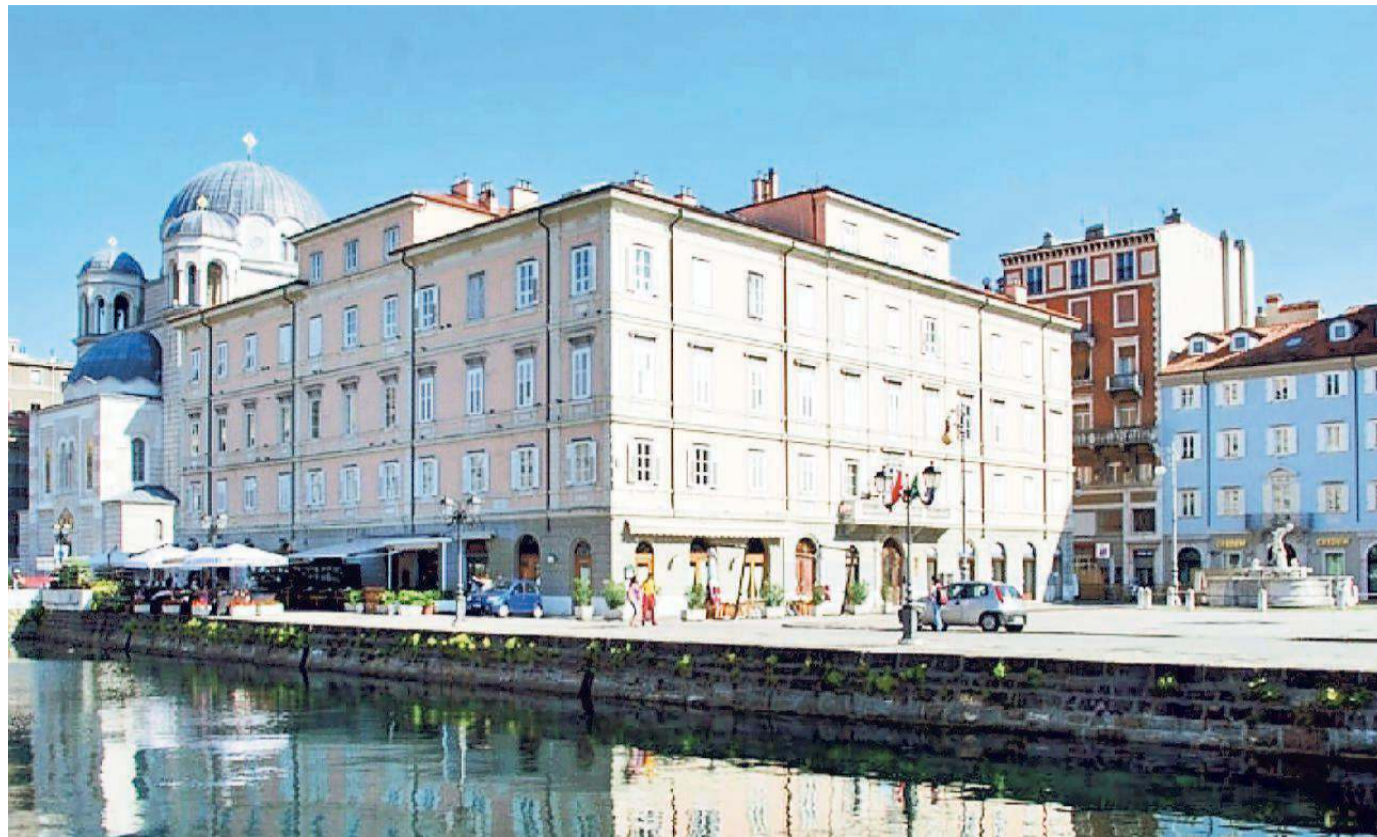
La sede dell'Università popolare in piazza Ponterosso in un'immagine di repertorio